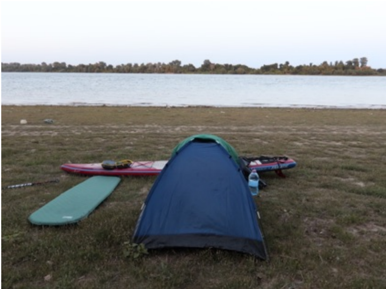
17. September 2017: Donauflosskilometer 122 – Kurz hinter Reni/Ukraine auf der rumänischen Seite

Am Abend des 60. Tages meiner SUP-Tour saß ich auf der rumänischen Seite an der Donau und blickte hinüber auf das ukrainische Ufer. Der starke Wind des Tages hatte sich gelegt und das Wasser floss sanft an mir vorüber. Alles um mich war ruhig und es herrschte Frieden.