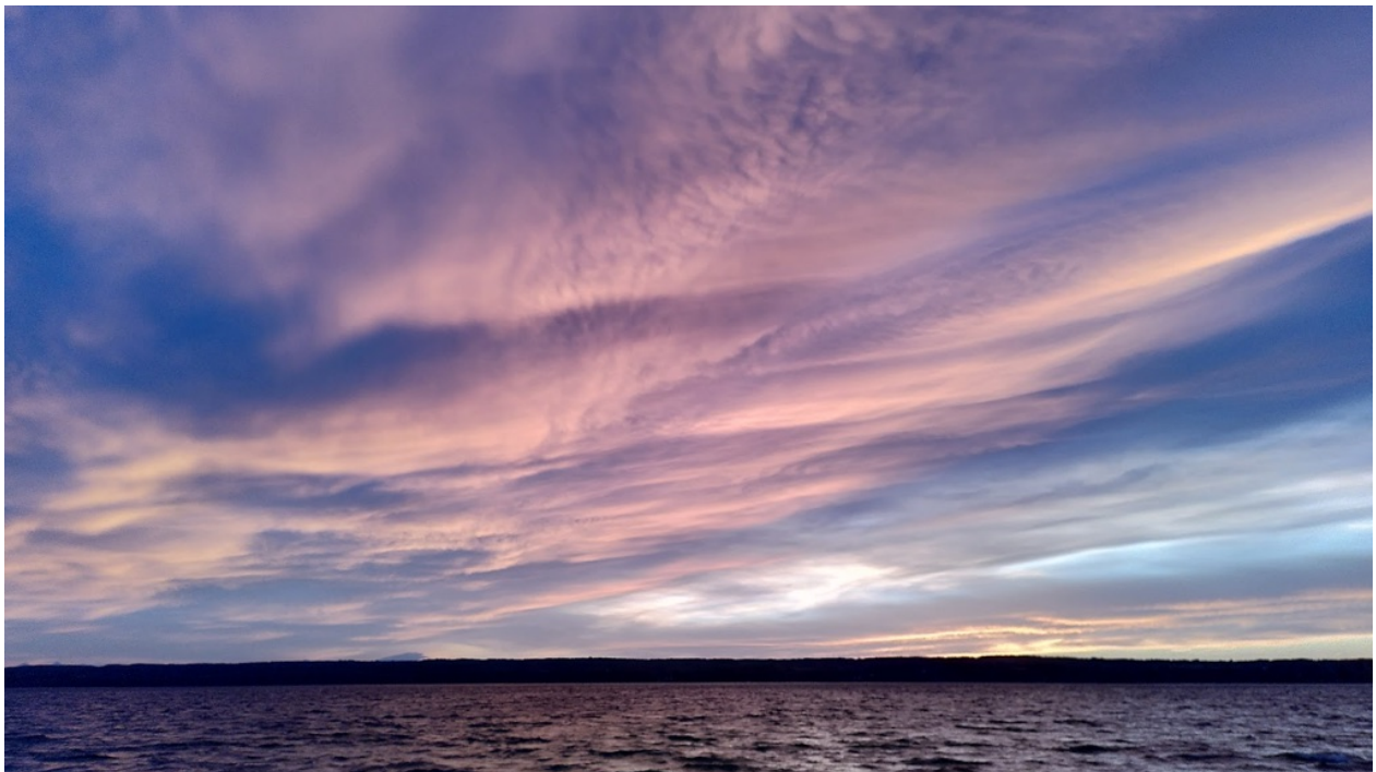
Die Blaue Stunde am Ammersee am 24. Februar 2022

die Zeit der Blauen Stunde am Ammersee ist für mich immer wieder ein spezieller Moment, um zur Ruhe zu kommen und tief durchzuatmen. Die abendliche Blaue Stunde ist die Zeitspanne, in der sich die Sonne so weit unterhalb des Horizonts befindet, sodass das blaue Lichtspektrum am Himmel gerade noch dominiert und die Dunkelheit der Nacht bevorsteht.